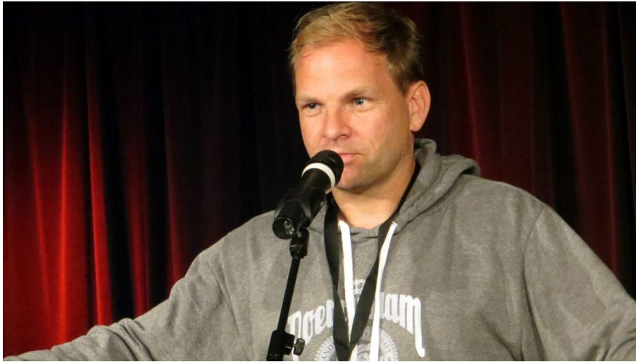
Bartels c J&ouml;rg Schwedler - © Jörg Schwedler