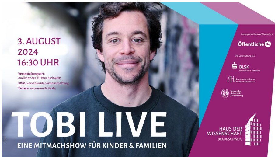
Veranstaltungspakat Tobias Krell