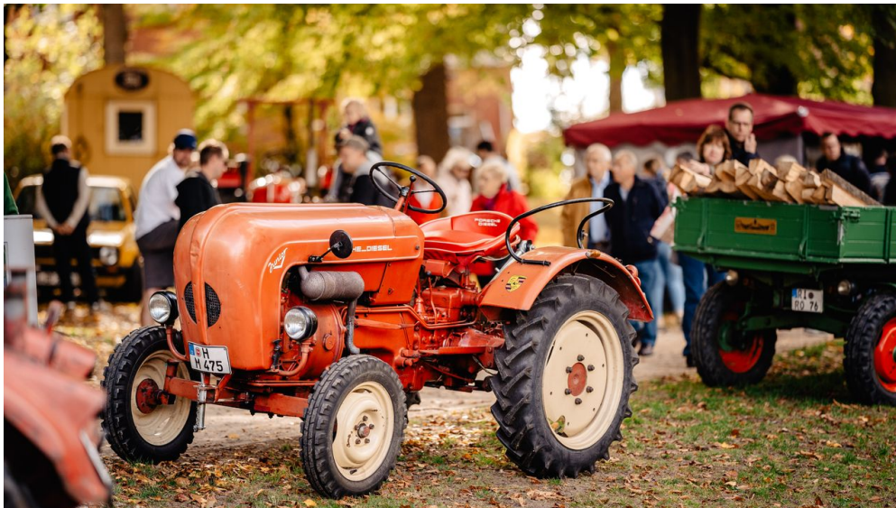
2022-10-16_KurT-Bauernmarkt_120.jpg

Es gibt ausreichend Parkmöglichkeiten um den gesamten Kurpark herum. Wir möchten darauf hinweisen, dass der nahegelegene Rewe-Parkplatz in der Kurhausstraße 4 ein Privatparkplatz ist und ausschließlich für Rewe-Kund:innen zur Verfügung steht. Widerrechtlich parkende Fahrzeuge werden kostenpflichtig abgeschleppt.