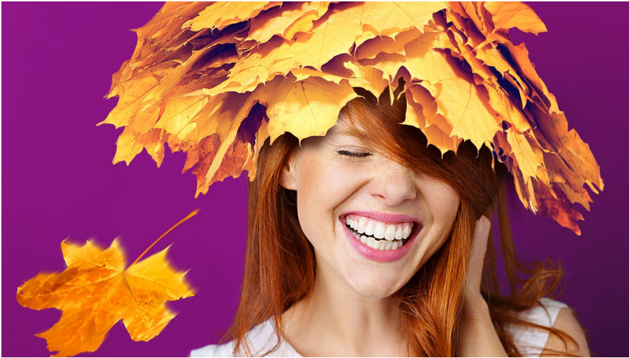
glückliche frau lacht mit geschlossenen augen