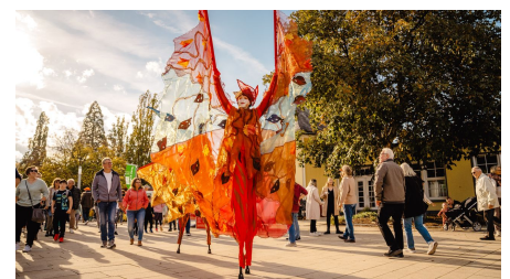
2022-10-16_KurT-Bauernmarkt_321.jpg