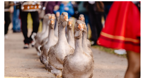
2022-10-16_KurT-Bauernmarkt_210.jpg