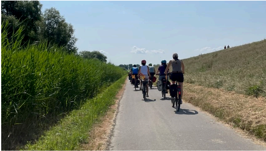
Morgens aufs Rad - © Stefan Heiland