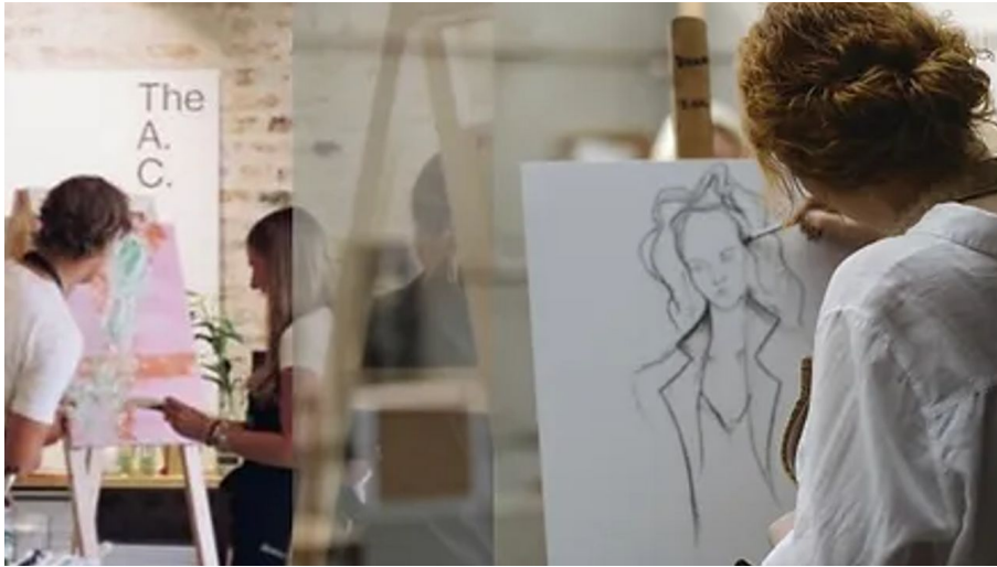
monatlicher Mal Treff.png