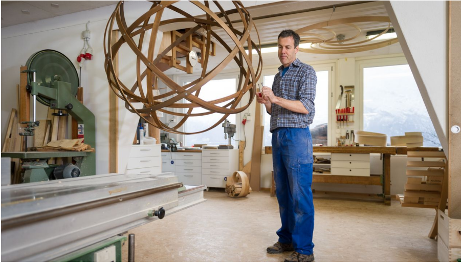
Schnitz Walker 160219 328 SK