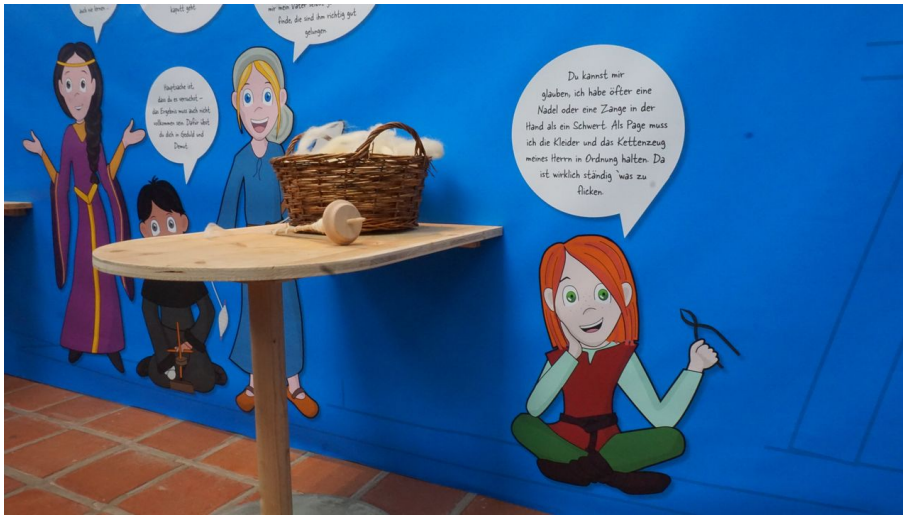
Alte Spinntechniken – neuer Faden