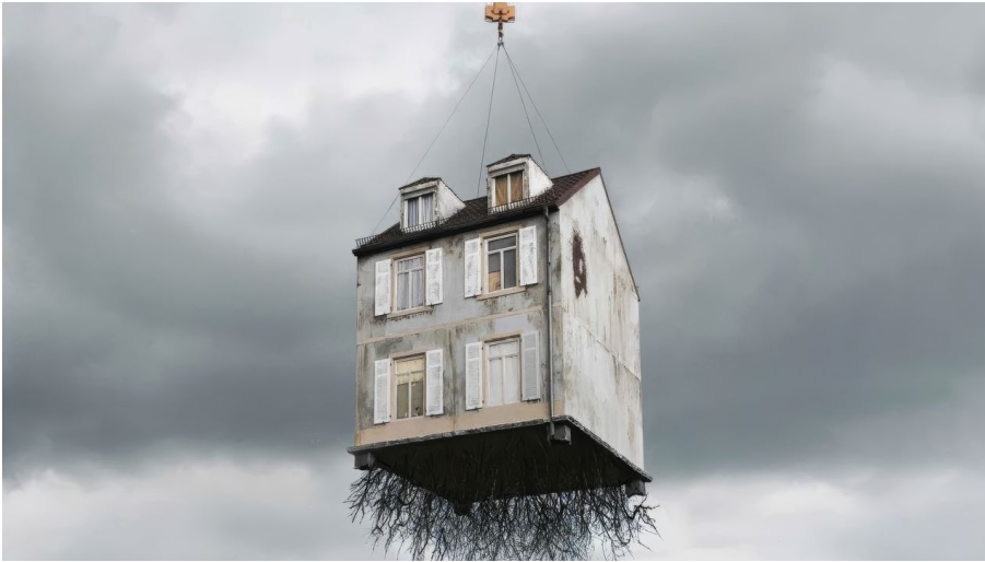
Leandro Erlich. Schwerelos - © Foto: © Leandro Erlich Studio