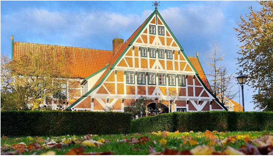
Rathaus Jork