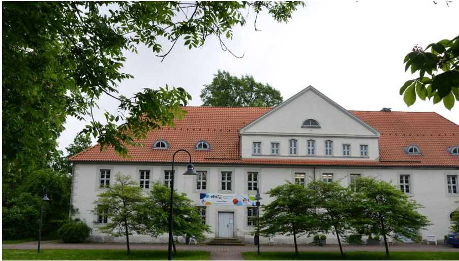
Kniestedter Herrenhaus mit Sitz der VHS Salzgitter