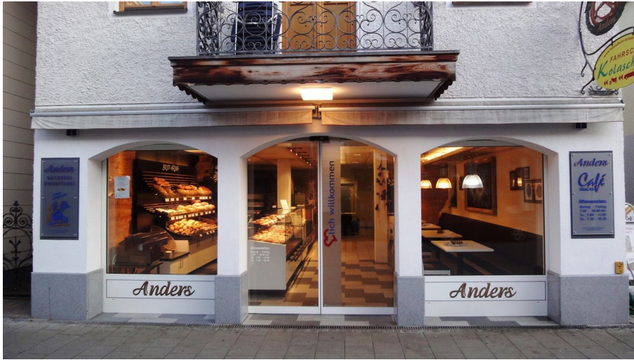
Bäckerei Anders - Filiale Bad Aibling