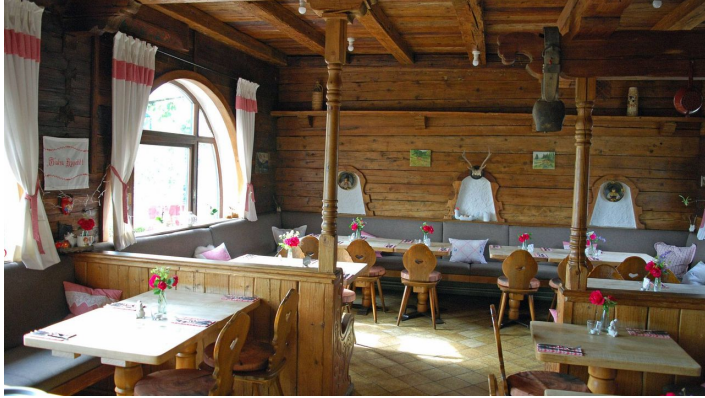
Hofer Stubn Bad Aibling