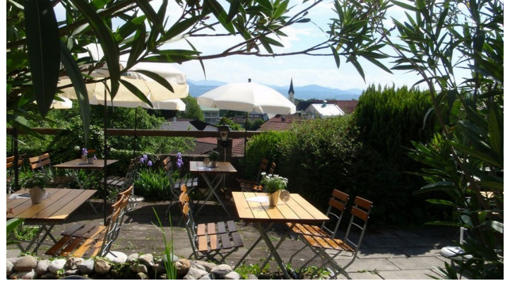
Hofer Stubn Bad Aibling