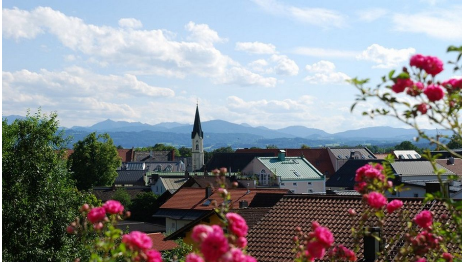
Hofer Stubn Bad Aibling