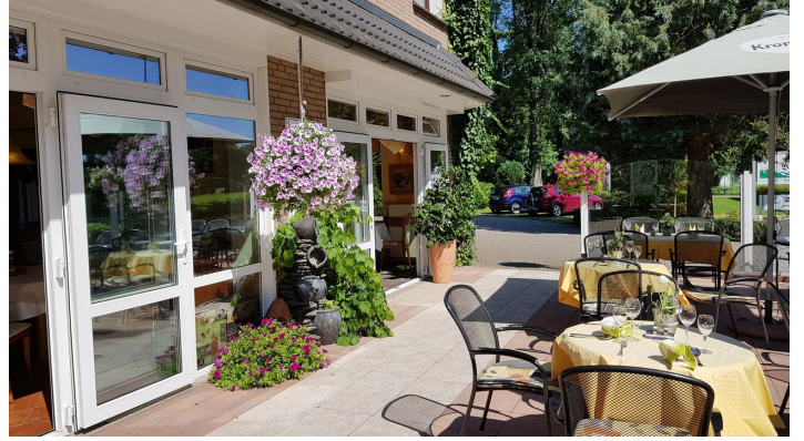
Gasthof Bucksande Terrasse