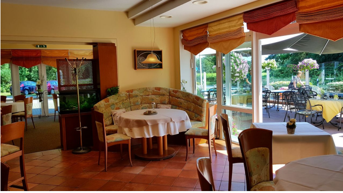
Gasthof Bucksande Innenansicht