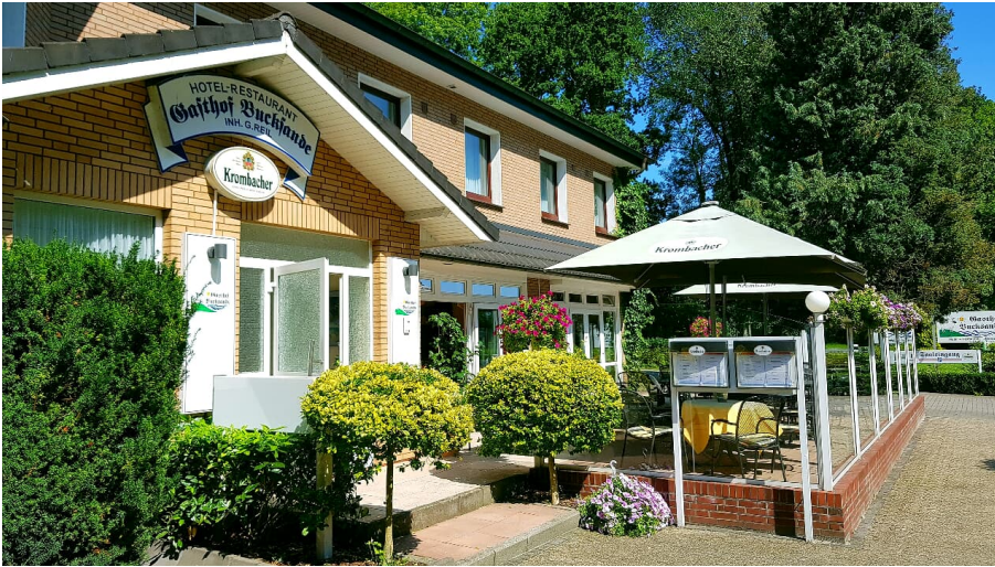
Gasthof Bucksande Außenansicht