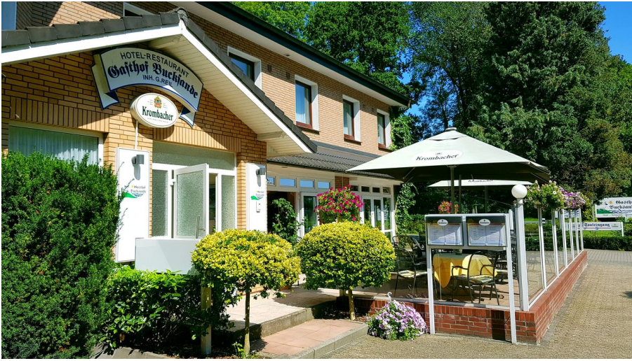
Gasthof Bucksande Außenansicht