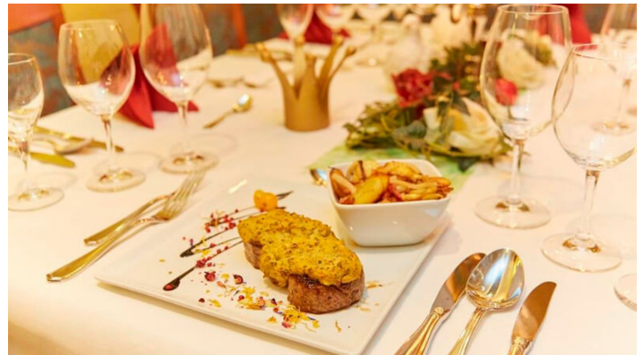
hotel-stadthoexter-gedeckertisch-c-marcusbrodt - © Rainer Sievers