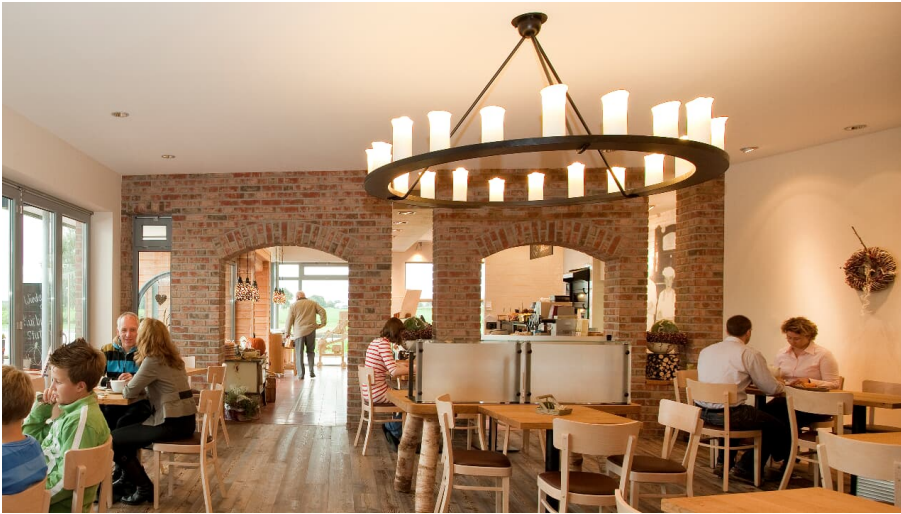
Bäckerei Ripken Innenansicht