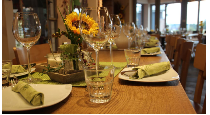
Bäckerei Ripken