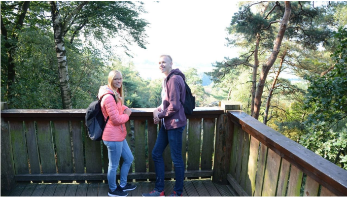
An der Aussichtsplattform an den Dörenther Klippen