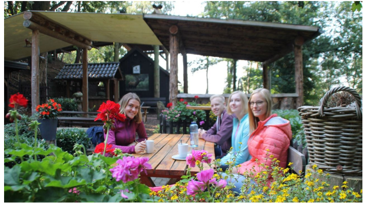
Rast an der Almhütter