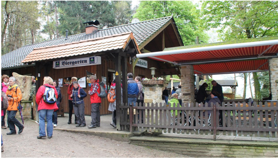
Dörenther Klippen_Almhütte_Teutoburger Wald Tourismus.JPG