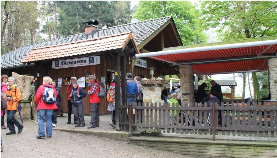
Dörenther Klippen_Almhütte_Teutoburger Wald Tourismus.JPG