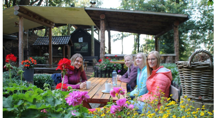
Rast an der Almhütter