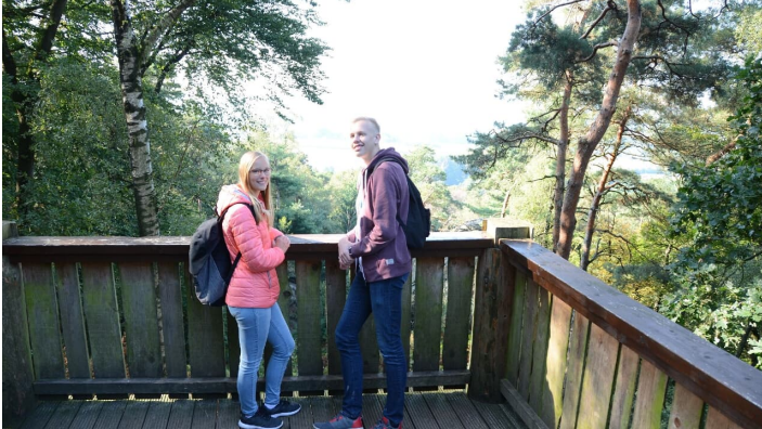
An der Aussichtsplattform an den Dörenther Klippen - © Stadtmarketing Ibbenbüren, M. Windoffer