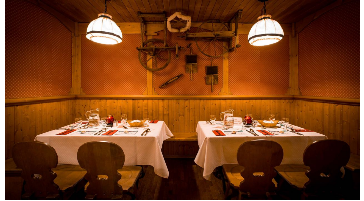
Interlaken Tourismus, Congress Kursaal Interlaken - web@interlakentourism.ch