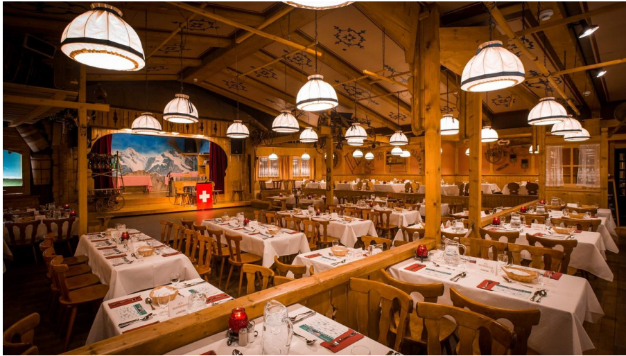
Restaurant Spycher, Interlaken