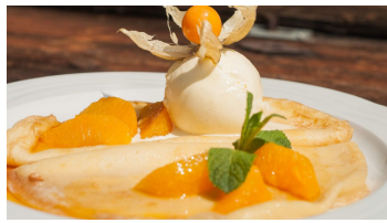
Seerestaurant Löwen, Brienz