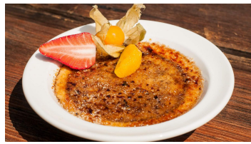
Seerestaurant Löwen, Brienz