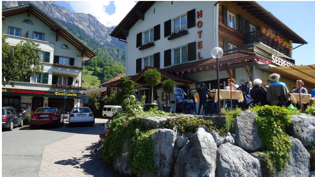
Seerestaurant Löwen, Brienz