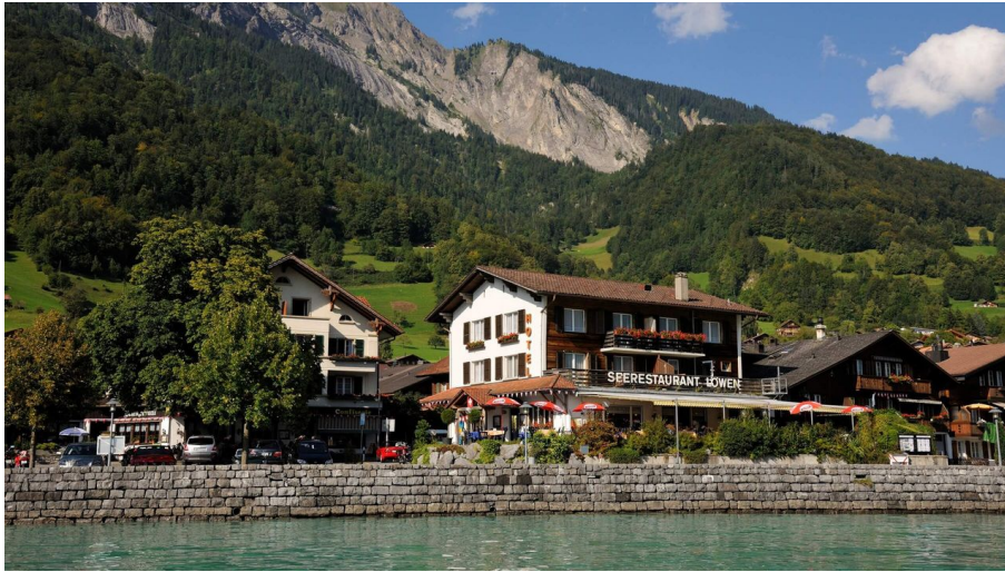
Seerestaurant Löwen, Brienz