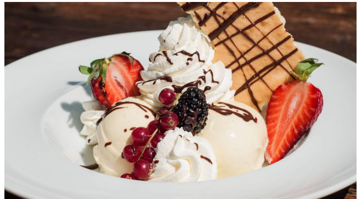
Seerestaurant Löwen, Brienz