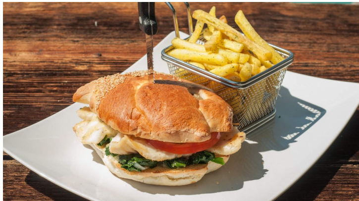
Seerestaurant Löwen, Brienz