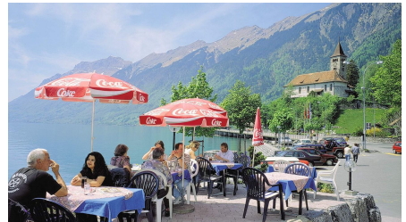
Seerestaurant Löwen, Brienz