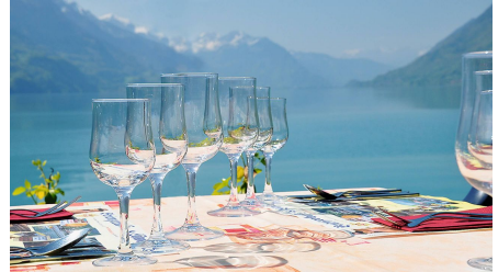
Seerestaurant Löwen, Brienz