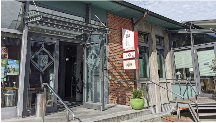
Restaurant Am Wasserturm, Heide