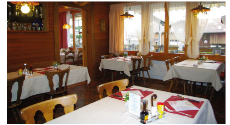
Hotel Restaurant Adler, Sigriswil, Interlaken Tourismus - web@interlaketourism.ch