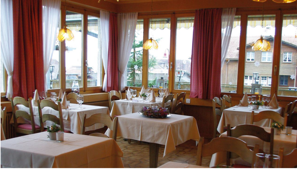
Hotel Restaurant Adler, Sigriswil