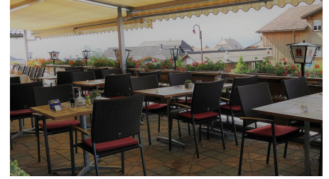
Hotel Restaurant Adler, Sigriswil