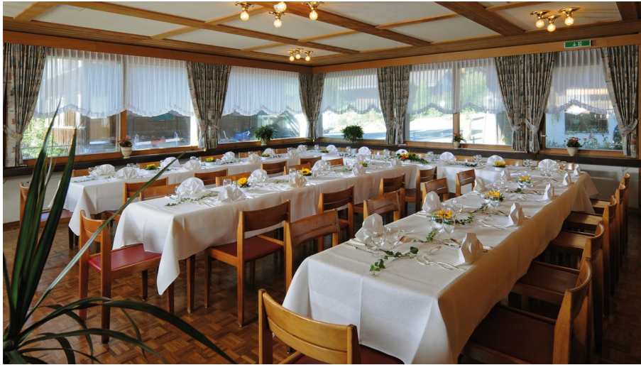
Hotel Restaurant Adler, Sigriswil