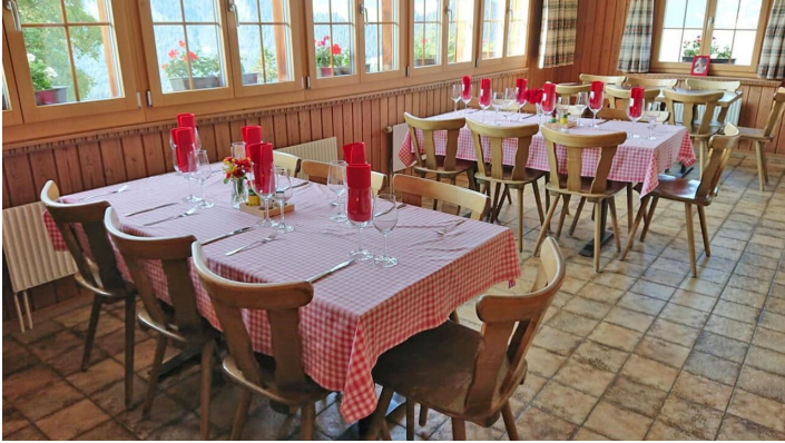
Salle d'hôtes du restaurant Springenboden