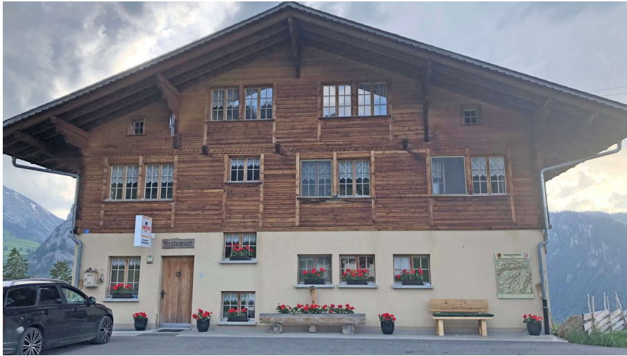
Restaurant Springenboden vue extérieure