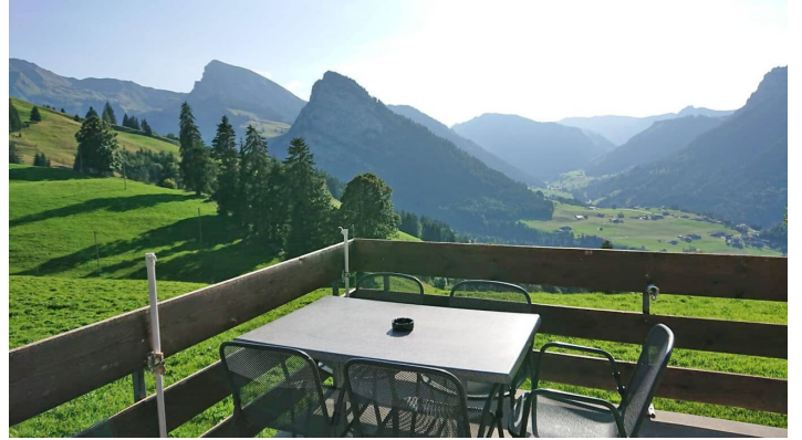
Restaurant Springenboden vue