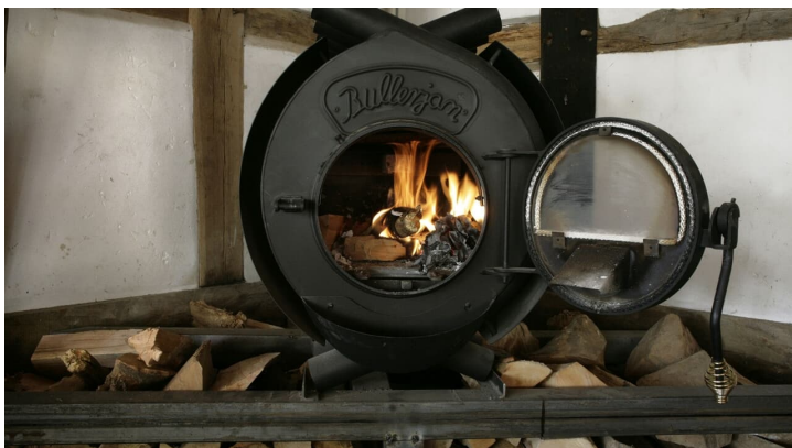
Ofen - © Christian Schulz, Seekrug am Obersee