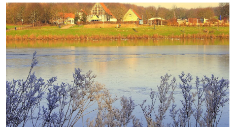
Winterhauch Obersee