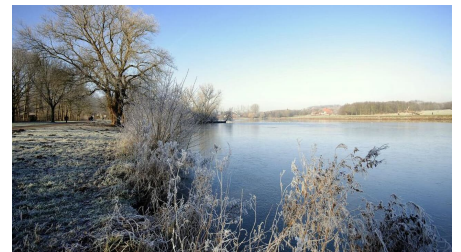
Winterhauch Obersee

Qualitätsgastgeber Wanderbares Deutschland