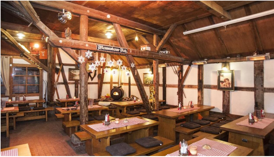
Hüttenparty Seekrug am Obersee