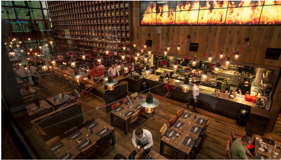
The Ash Blick von der Empore