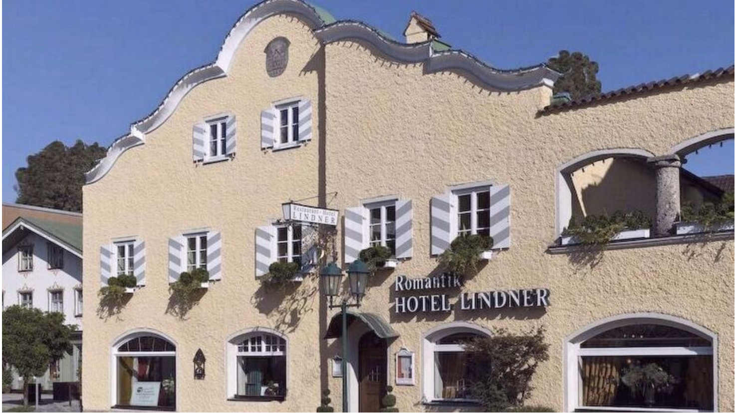
Das Lindner Bad Aibling