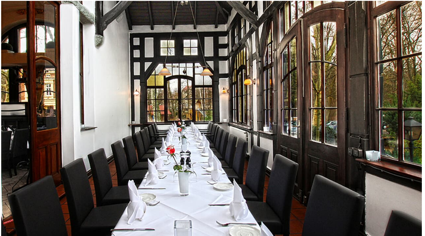
bw_9 - © DeepBlue-art.de, B. Reinhardt

Dienstag bis Sonntag 11:30 Uhr bis 14:30 Uhr und ab 18:00 Uhr