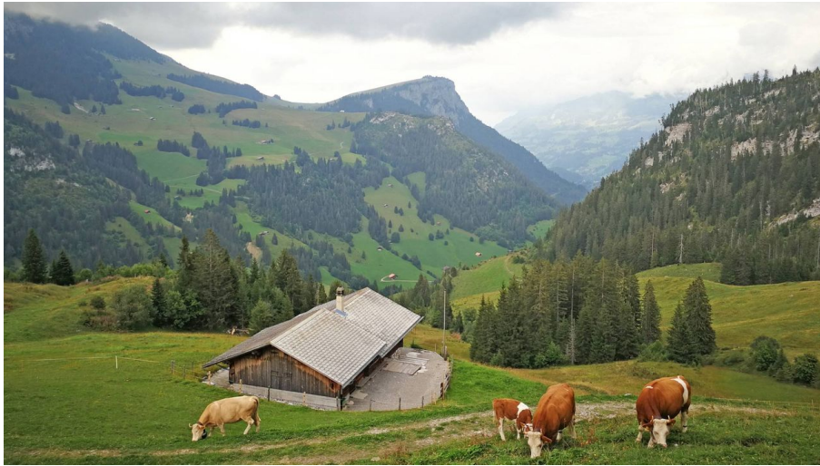
Bergrestaurant Sennhütte Menigwald, Zwischenflüh