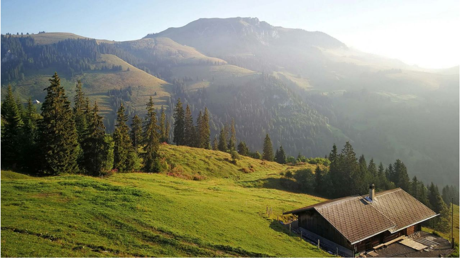
Bergrestaurant Sennhütte Menigwald, Zwischenflüh