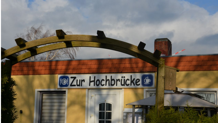
Gaststätte zur Hochbrücke