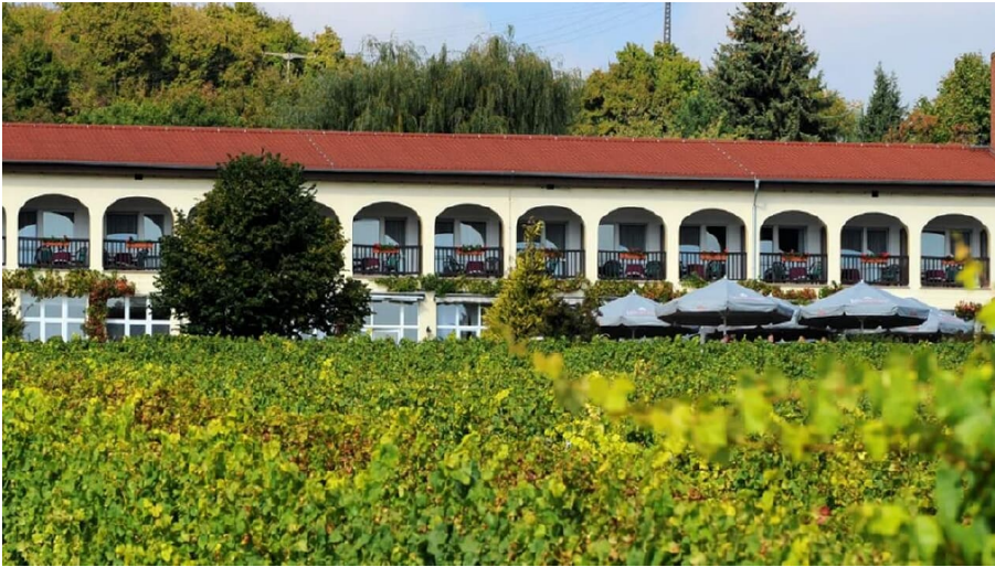
hotel_rebschule - © Hotel Rebschule