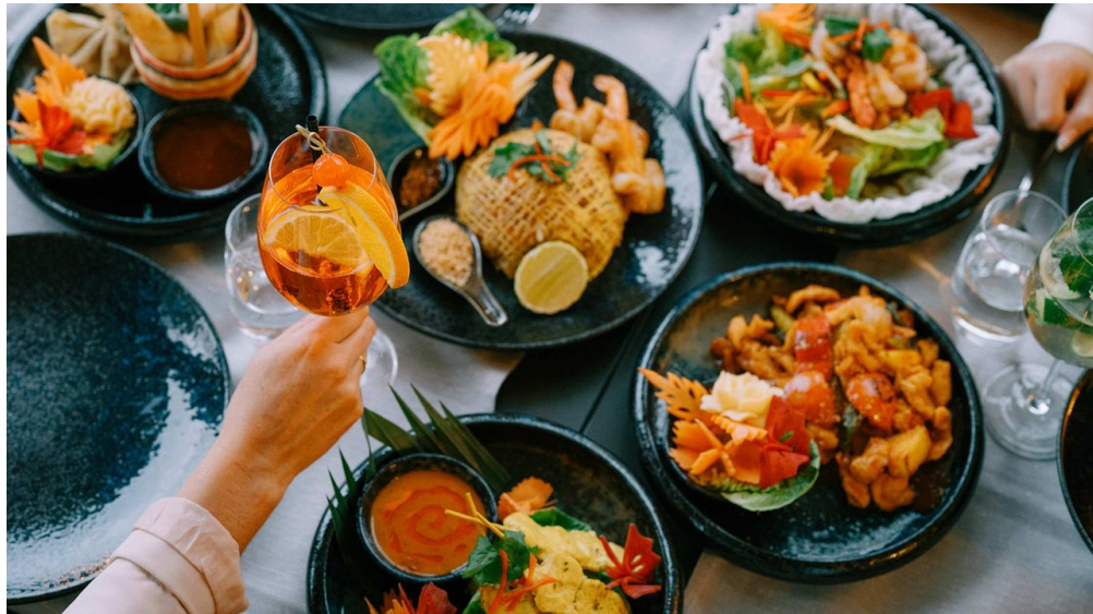
deltapark-restaurant-deltaverde-thai-cuisine-teller.jpg