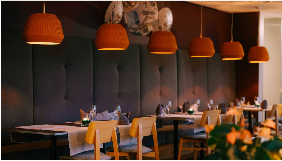
deltapark-restaurant-deltaverde-thai-cuisine-ambiente.jpg