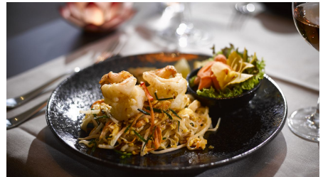
thai-cuisine-deltapark-hauptspeise