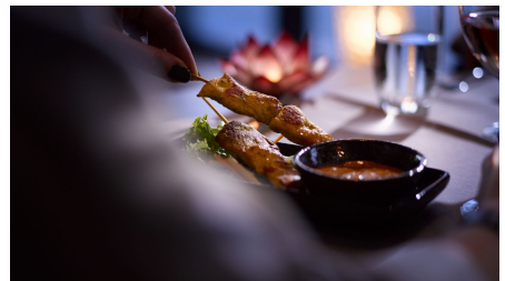
thai-cuisine-deltapark-vorspeise - "Thai Cuisine" - Deltapark Vitalresort, Gwatt, Interlaken Tourismus - web@interlaketourism.ch