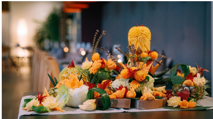
deltapark-restaurant-deltaverde-thai-cuisine-dekoration.jpg