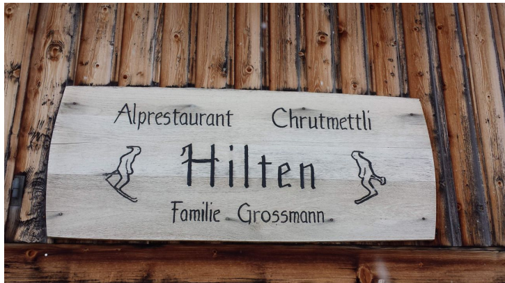
restauant-hiltten-axalp-schild-hinweis