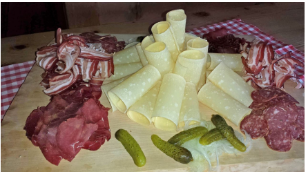
restaurant-hiltten-axalp-wurs-kaese-plaettli