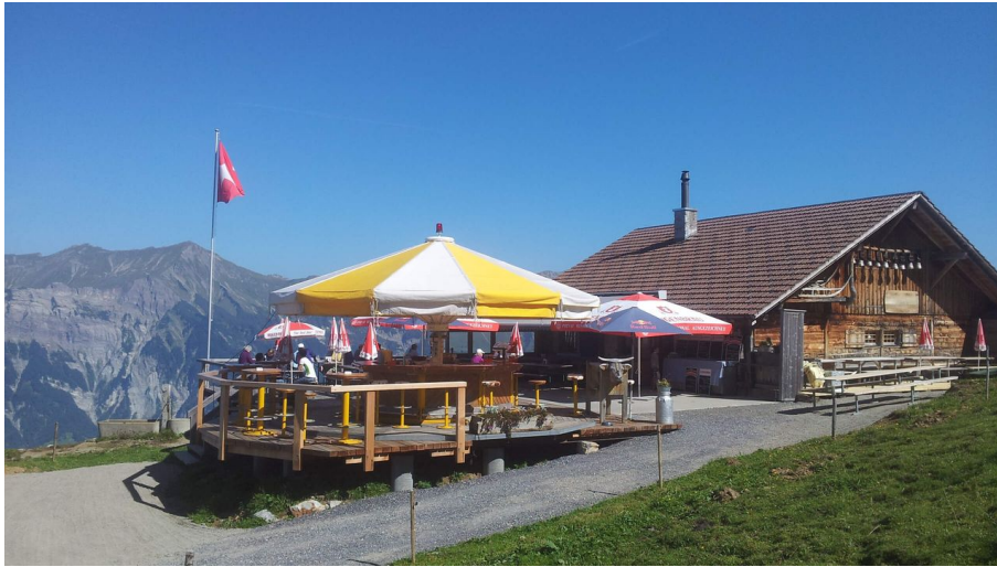
restaurant-hilten-axalp-terrasse-aussicht