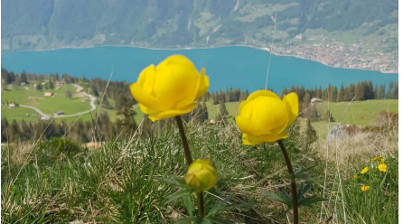
restaurant-hiltten-axalp-aussicht-blume-ankebaelli-brienzersee