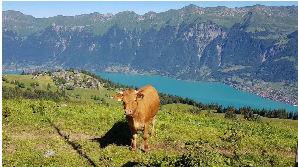
restaurant-hiltten-axalp-aussicht-brienzersee-kuh