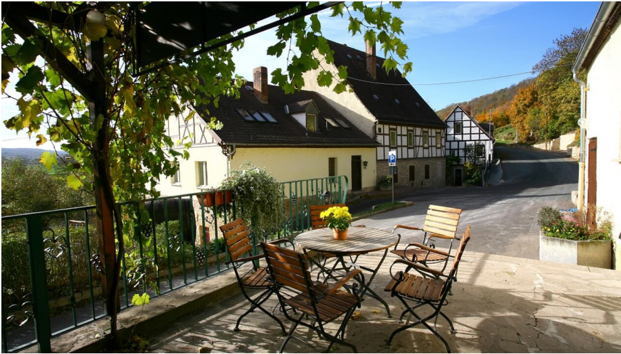
Weinstube Saalhäuser Bad Kösen