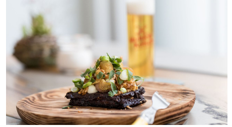
NeoBiota-06-Jennifer-Braun KoelnTourismus-GmbH.jpg