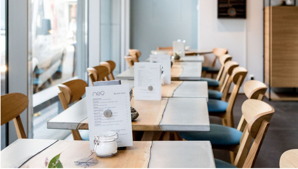
NeoBiota-01-Jennifer-Braun KoelnTourismus-GmbH.jpg