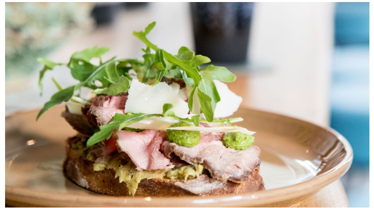
NeoBiota-09-Jennifer-Braun KoelnTourismus-GmbH.jpg