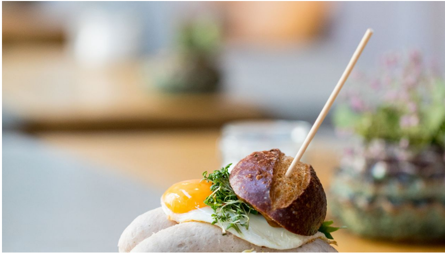
NeoBiota-02-Jennifer-Braun KoelnTourismus-GmbH.jpg