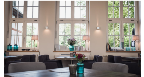
Genusswerkstatt interior