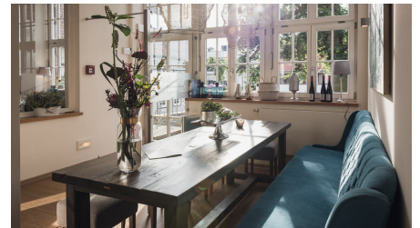
Genusswerkstatt interior 2 - © Paul Muders