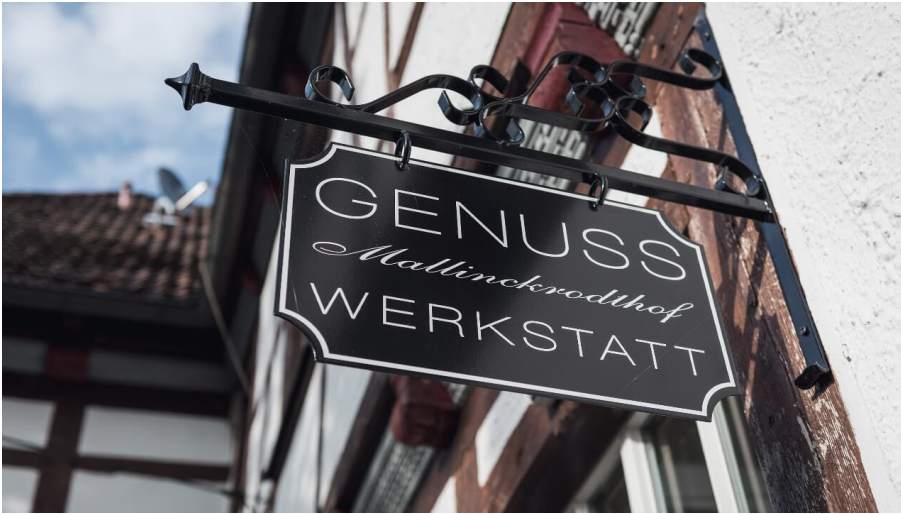
Genusswerkstatt exterior