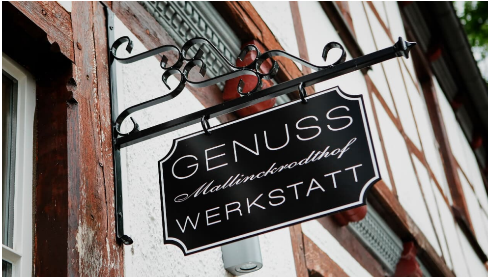
Herzlich Willkommen!