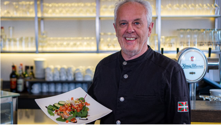
André Cramer - © Farbecht