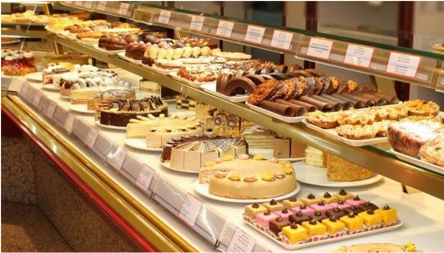
Cafe Kreiner.jpg