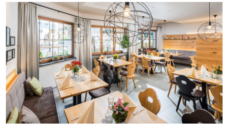
Renovierter Gastraum