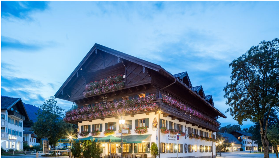
hundehotelwoolf-35.jpg - © (c) Florian Busch