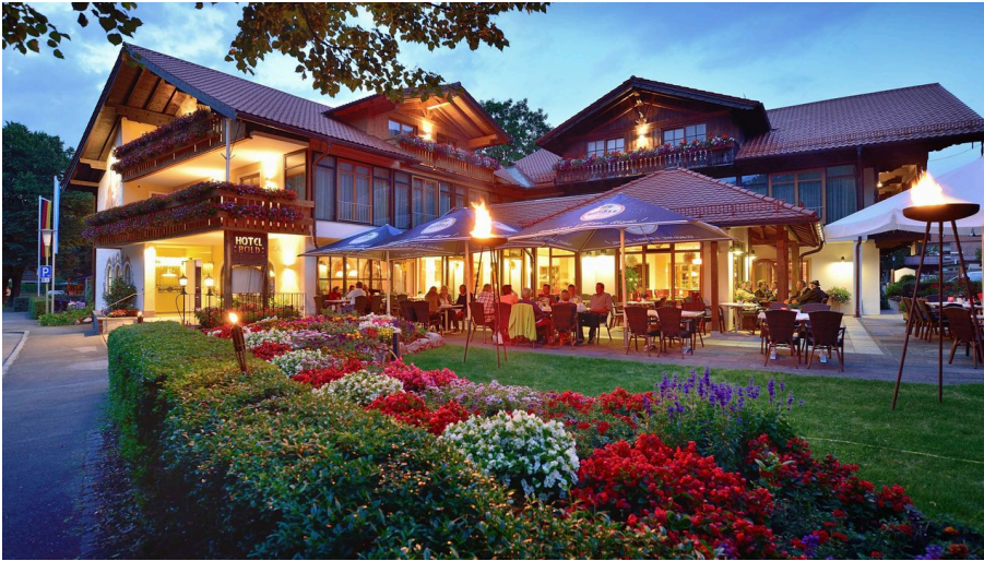
DSC_1983.jpg - © klaus hecke , Klaus Hecke / netcondition.de