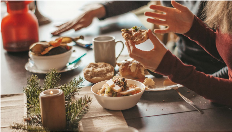
Musterbild Frühstück - (Symbolbild)