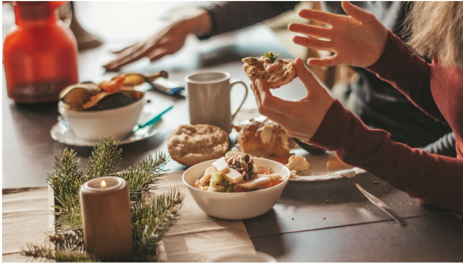
Musterbild Frühstück - (Symbolbild)