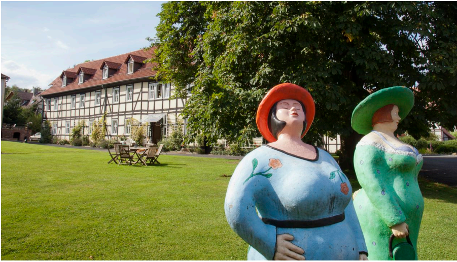
2012 - KURladies Bad Zwesten.JPG