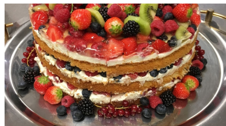
Seecafe_3.JPG - © Seecafé Rheda-Wiedenbrück