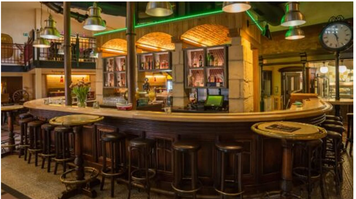
Brauhaus Espelkamp

Unsere Öffnungszeiten Montag – Freitag von 11:30 bis 14:30 Uhr Sonntag 09:30 Uhr – 14:30 Uhr Dienstag – Sonntag ab 17:00 Uhr