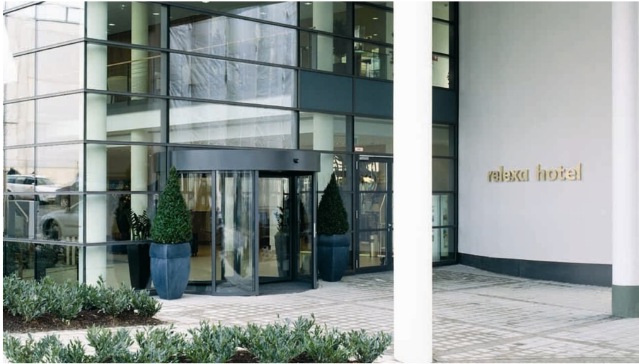
Relexa Hotel Ratingen City