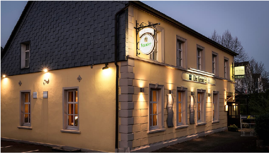
Hotel und Restaurant "Die Krone" in Ratingen