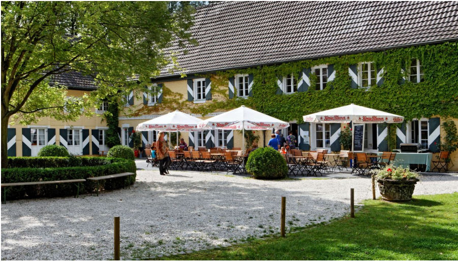
Gastronomie der Wasserburg Haus Graven in Langenfeld