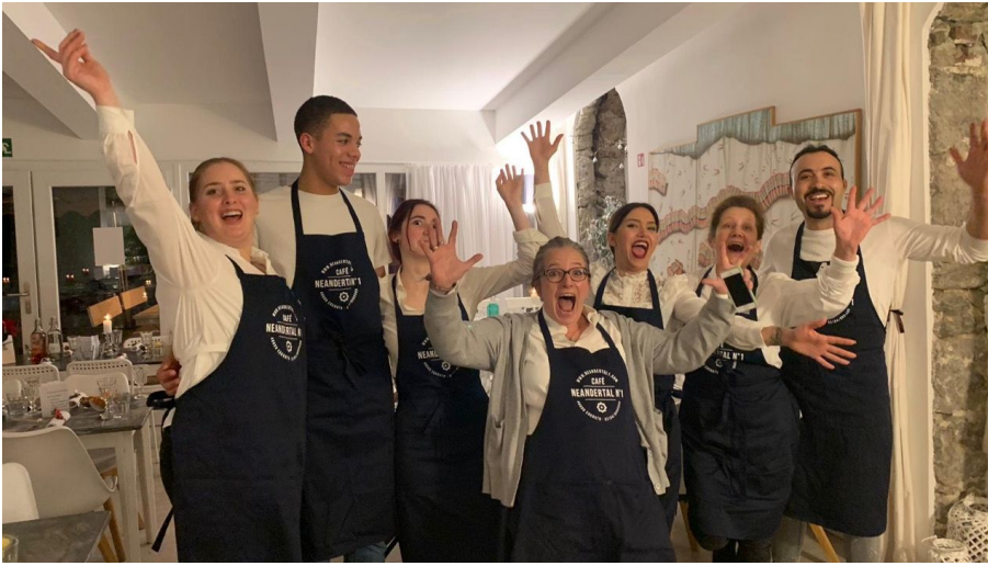
Team von Neandertal No.1 im Neandertal in Erkrath