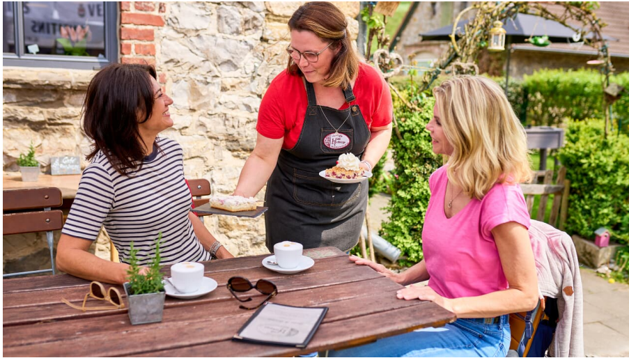
Cafe Herberge in Heiligenhaus