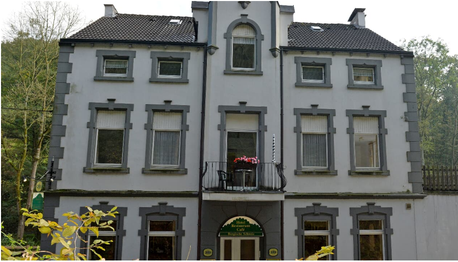
Hotel Bergische Schweiz