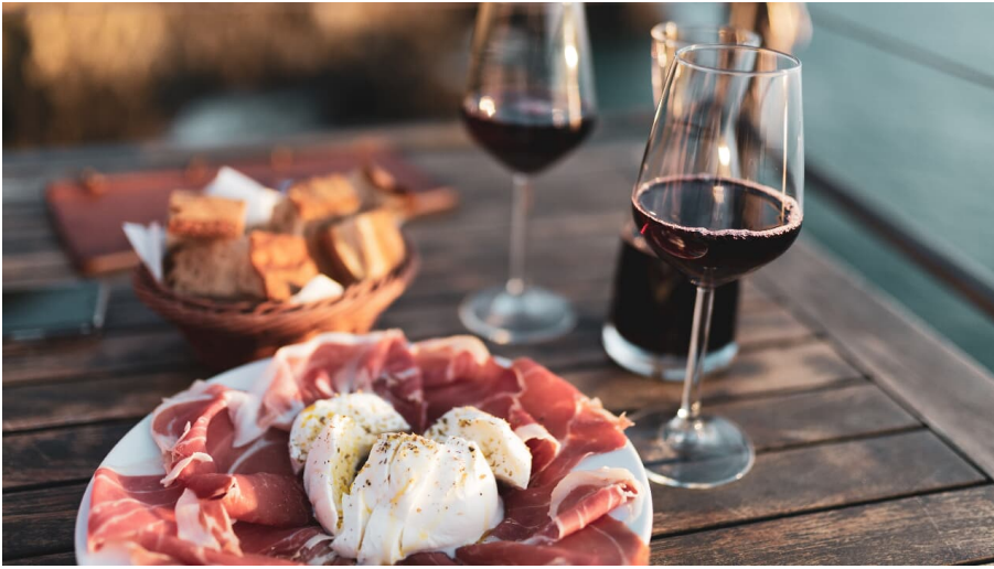
Musterbild Gastronomie - (Symbolbild)