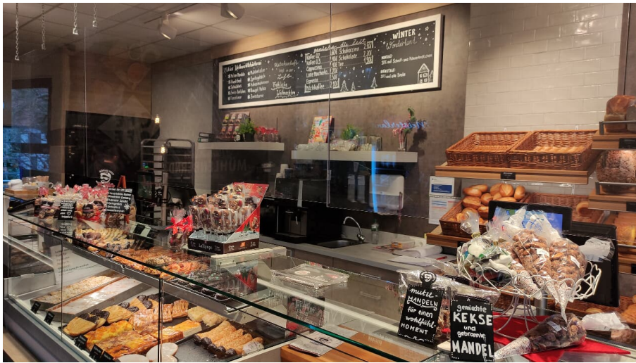
Tresen Backparadies Mühlenbernd