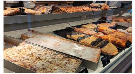
Kuchen Backparadies Mühlenbernd