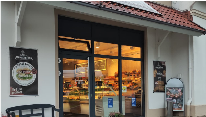
Außenansicht Backparadies Mühlenbernd