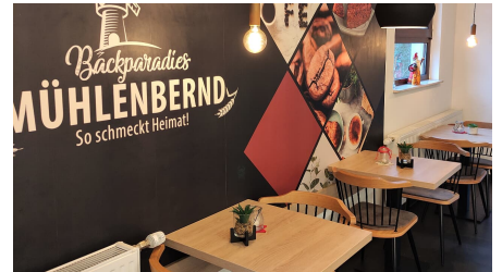
Sitzbereich Backparadies Mühlenbernd