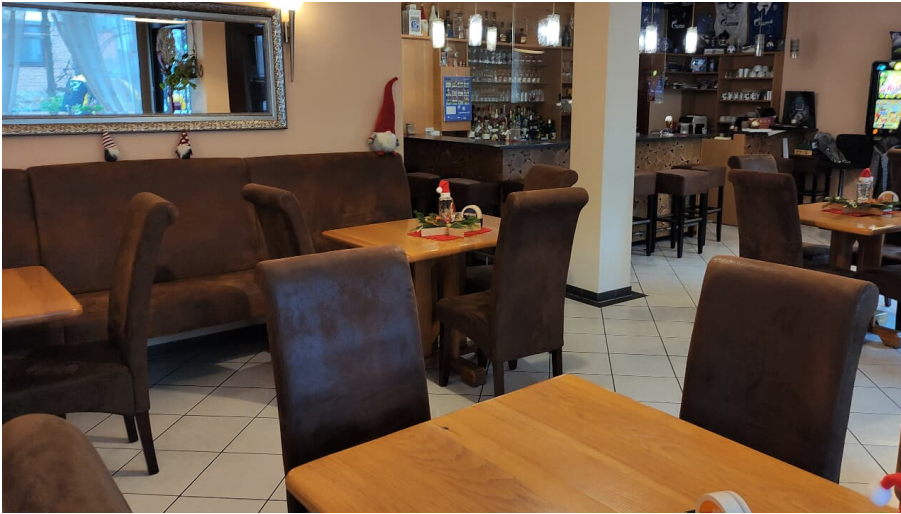
Innenraum Pinocchio