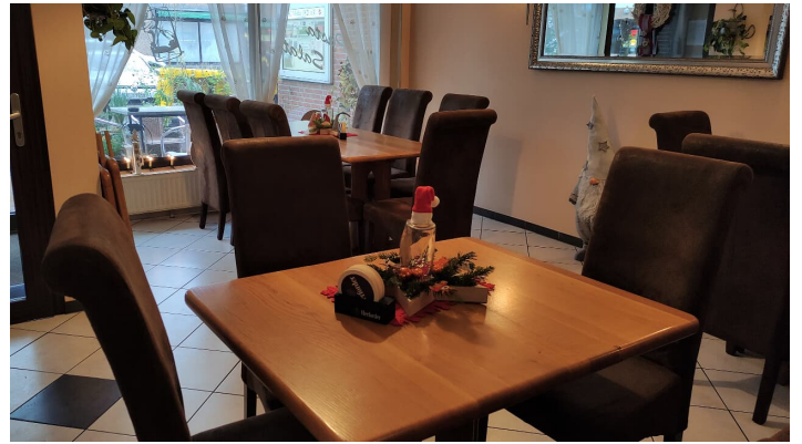
Sitzplätze Pinocchio