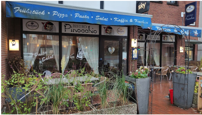
Außenansicht Pinocchio